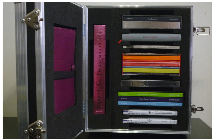
La Valise l'autobiographie selon Sophie Calle