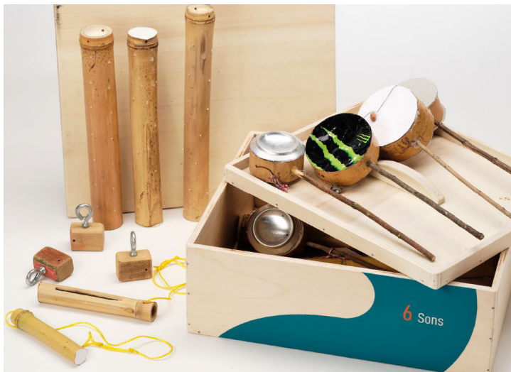
Une des boites composant la Petite collection