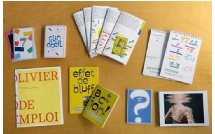
Les livrets du Studio de poche Olivier Rebufo