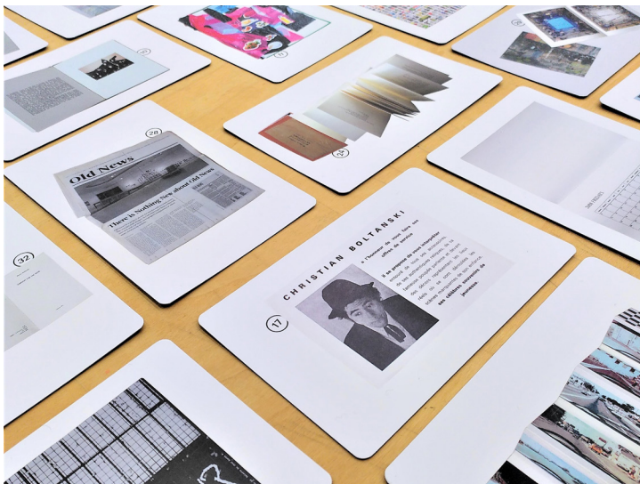
Le jeu Qui suis-je? du sac Délivrez-vous !