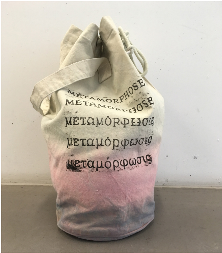
Le Sac métamorphose