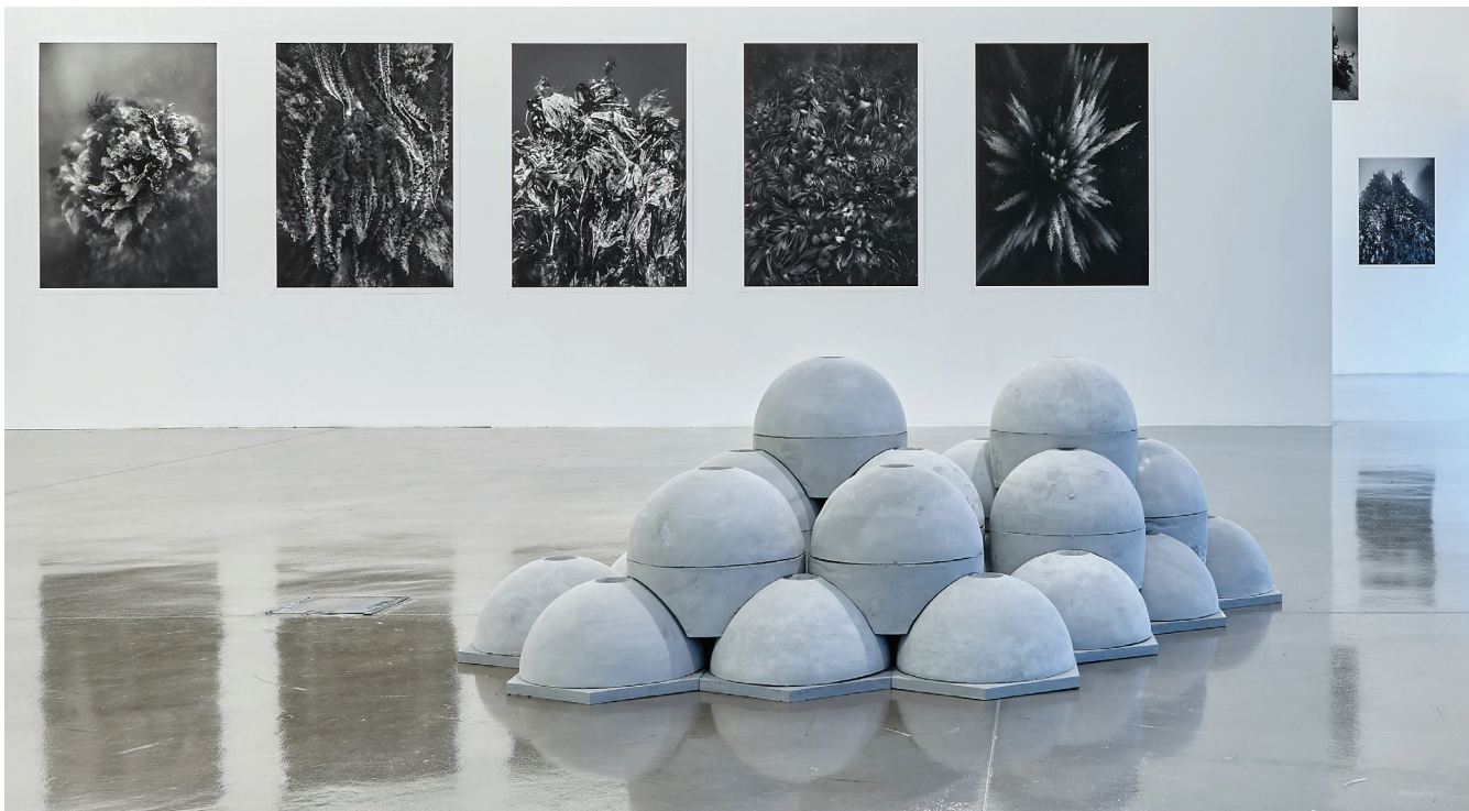
Nicolas Floc'h, Initium Maris , vue de l'exposition Nicolas Floc'h, Paysages productifs, 2020. © ADAGP, Paris, 2020. Crédit photo photo Frac Provence-Alpes-Côte d'Azur / Laurent Lecat.

Depuis plusieurs années, Nicolas Floc'h s'intéresse à la présence de récifs artificiels au fond des mers. Il inventorie les étonnantes formes de ces habitats protecteurs pour la faune et la flore sous-marines.