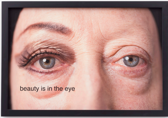
Beauty is in the eye, 2014

L'artiste Martha Wilson s'empare de techniques variées pour mettre en forme ses autoportraits, réaliser ses mises en scènes et archiver le corps en mouvement. Que ce soit par la photographie, la vidéo, le travail de l'écriture ou encore ses performances en direct, ses œuvres nous transportent dans un univers visuel et réflexif empreint d'humour.