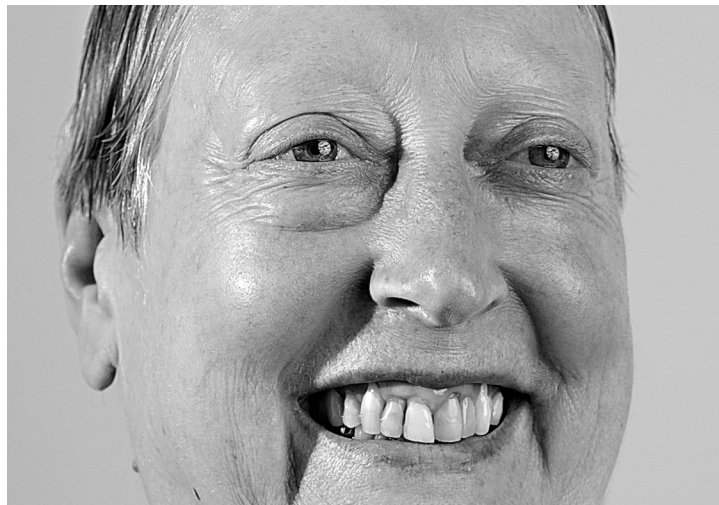
I have become my own worst fear / Deformation, 2009/1974