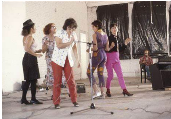
photographie du groupe DISBAND

Quelle place et quelles opportunités pour les femmes depuis les années 70 à nos jours ? L'artiste questionne dès ses premières œuvres les rôles attribués aux femmes dans la société occidentale, en mettant en avant et détournant les clichés, critères de beauté et figures féminines médiatiques. Ce sujet évolue en même temps que l'artiste vieillit, et que son corps est soumis à de nouvelles injonctions esthétiques.