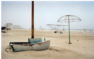
Constellation des paysages horizontaux, Port-Saïd, Égypte

Photographe indépendant, Franck Pourcel questionne à travers son travail les rapports que l'homme entretient avec son environnement. Sa photographie, qui allie regard documentaire et création artistique, met en lumière les différentes façons de vivre son territoire, de l'habiter. Le regard singulier de Franck Pourcel construit une géographie sensible, personnelle, volontairement subjective : une géopoétique. Depuis de nombreuses années, il explore l'évolution du paysage méditerranéen en interrogeant sa modernité où se confrontent immuabilité et changement.