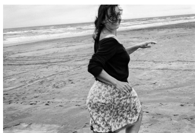
Camargue, France, 2007