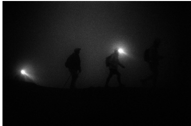
Stromboli, Italie, 2008