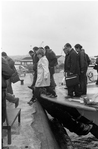
Istanbul, Turquie, 2011

« Au vrai, la seule constellation qui paraisse manquante dans ce projet, concernerait directement le photographe lui-même, Franck Pourcel. On rétorquera qu'au cours des treize figures stellaires qu'il construit, sa présence est constante, transcende les apparences du réel qu'il photographie, pour dessiner en creux, derrière l'histoire collective, un singulier portrait, un "tracé entièrement subjectif", selon ses propres termes. Que ce projet, né sous la forme d'une commande, se transforme en expérience existentielle vitale, salvatrice, intervenant "au moment de [s]a propre perte", lui confère une gravité dont, bien souvent, trop d'entreprises artistiques contemporaines sont dépourvues. Dans le Manifeste photobiographique qu'avec Claude Nori nous publions en 1983, appelant la photographie à dépasser son caractère strictement documentaire ou ses points de vue esthétiques distancés, pour privilégier l'attitude autobiographique inhérente à tout projet photographique, nous souhaitons que celui-ci puisse correspondre, pour chacun, à l'exploration de ce que nous nommons – encore Joyce! – le "territoire épiphanique". À l'évidence, Franck Pourcel met ici en scène, avec un éclat photographique subtil et rare, l'intime force du sien. »