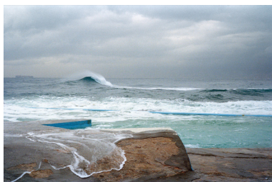
Beyrouth, Liban, 2011