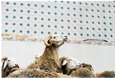
Aïd el Kebir, Oran, Algérie, 2011

Maintenant j'ai besoin d'écrire, de mettre en mots, en phrase toute cette expérience, aussi bien le vécu sur le terrain que le vécu avec les institutions. Intellectualiser tout cela et particulièrement la notion de récit photographique. Et de partir sur d'autres territoires comme l'Asie, d'autres territoires tout aussi sensibles et humains car il s'agit toujours pour moi de mettre la place de l'Homme au centre de toutes les (mes) préoccupations.»