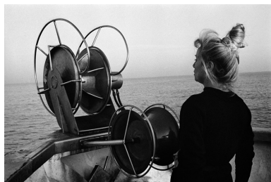
Saintes Maries de la mer, France, 1994

Propos recueillis par Claude Lorin pour le journal Zibeline, décembre 2013.