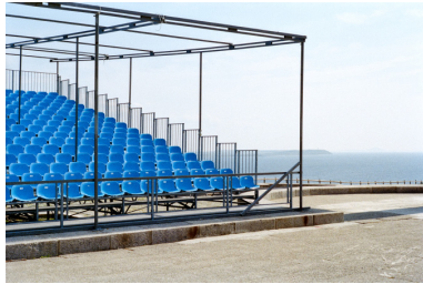
Galipoli (Turquie), 2011