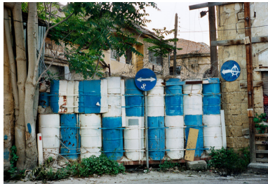
Nicosie, Chypre, 2011

Avant de voir la moindre image, le spectateur est ainsi saisi par le gigantesque graphe né de la relation des points de la méditerranée qui forment le parcours à effectuer, mais c'est moins une carte marine qui lui apparaît qu'une carte d'astronome.