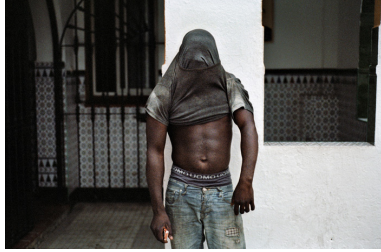
Migrant, Algésiras, Espagne, 2012