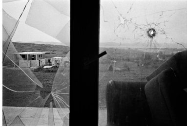
Sur la route de Mostar, Bosnie-Herzégovine, 1993