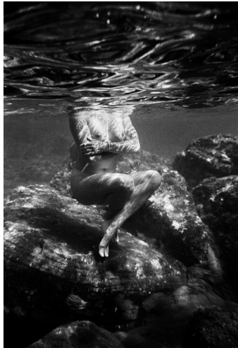
Le bain de Pénélope, Royaume d'Ithaque, 2004