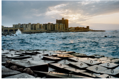
Alexandrie (Egypte), 2012