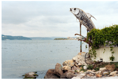
Çanakkale (Turquie), 2011

Finalisé au Frac en 2013, le projet Constellations regroupe des photographies prises au cours de voyages du photographe dans les trois continents qui bordent la méditerranée : l'Afrique, l'Asie et l'Europe. Récit photographique et sonore, les Constellations retracent l'Odyssée d'Ulysse, mise en parallèle avec une méditerranée contemporaine aux identités multiples. En s'intéressant à ce territoire éclaté, berceau des récits fondateurs de nombreuses civilisations, Franck Pourcel propose une mythologie réinventée.