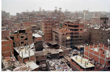
Le Caire, Egypte, 2012