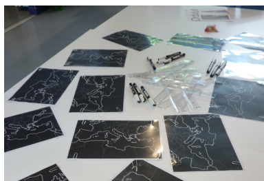
Ateliers avec Franck Pourcel à la médiathèque de Bandol, juin 2017