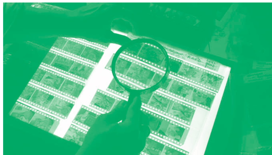
Le Roman algérien, chap. 3 , 2019, image extraite de la vidéo HD, 45 min. © Katia Kameli, ADAGP, Paris, 2021.