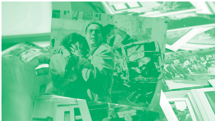
Le Roman algérien, chap. 3, 2019, image extraite de la vidéo HD, 45 min. © Katia Kameli, ADAGP, Paris, 2021.

Dans le cadre de la Saison Africa2020, avec le soutien d'Axian et de la Fondation H. Cette exposition fait partie de la programmation satellite des Rencontres d'Arles dans le cadre du Grand Arles Express.