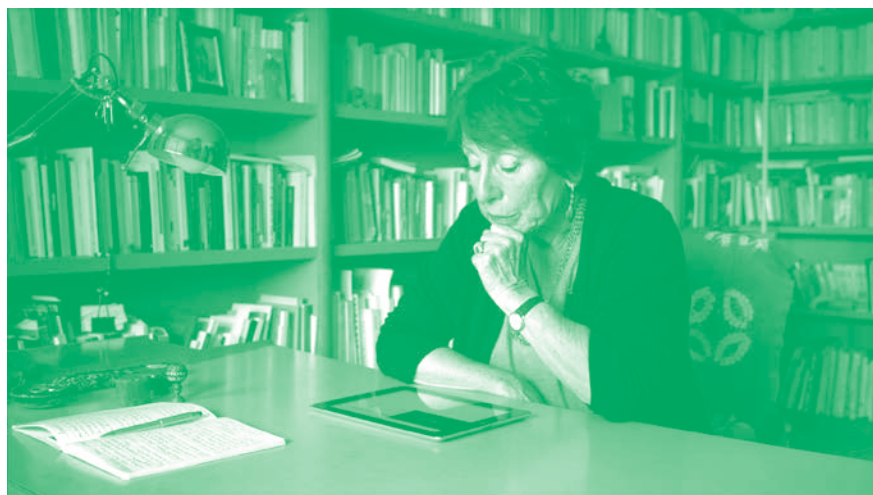
Le Roman algérien, chap. 2 , 2017, image extraite de la vidéo HD, 34 min. © Katia Kameli, ADAGP, Paris, 2021. Collection Frac Provence-Alpes-Côte d'Azur, acquisition 2017.