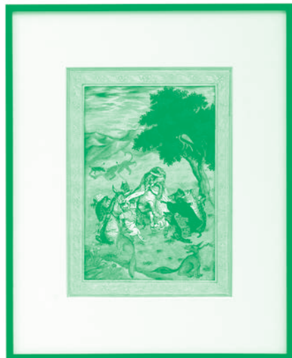
Les Animaux malades de la peste , 2016 Impression fine art, dorée à la feuille d'or 22 carats sur papier Awagami.