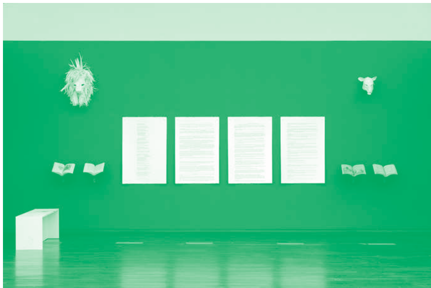
Vue d'exposition, Tous, des sangs-mêlés , Mac Val, Vitry-sur-Seine, 2017. © Katia Kameli, ADAGP, Paris, 2021.