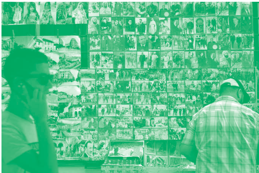
Le Roman algérien, chap. 1 , 2016, image extraite de la vidéo HD, 16 min 35 sec. © Katia Kameli, ADAGP, Paris, 2021. Collection Frac Poitou-Charentes, acquisition 2016.