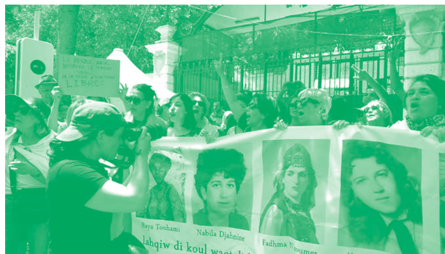
Le Roman algérien, chap. 3 , 2019, image extraite de la vidéo HD, 45 min. © Katia Kameli, ADAGP, Paris, 2021.