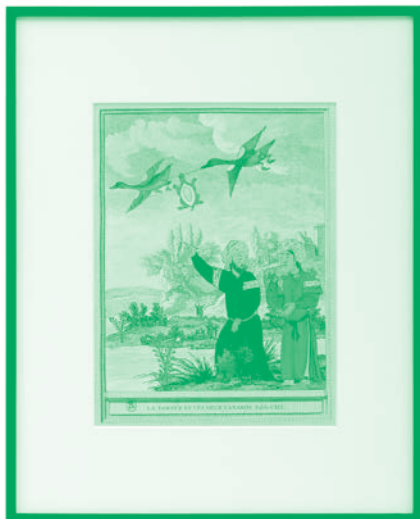
La Tortue et les deux canards , 2016. Impression fine art, dorée à la feuille d'or 22 carats sur papier Awagami.