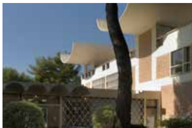
Les jardins de la Fondation Marguerite & Aimé Maeght de Saint-Paul-de-Vence

27 SEPT. - 3 JANV. 2021 / 27 SEPT. - 3 JAN. 2021: Géométrie de l'Invisible. Cette exposition immersive explore le rôle clé de la géométrie et de l'abstraction dans la création artistique. / An immersive exhibition about the key role geometry and abstraction play in artistic creation.