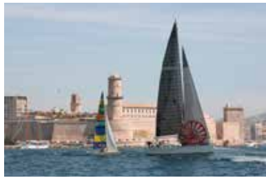
e Fraeme / Avec le vent