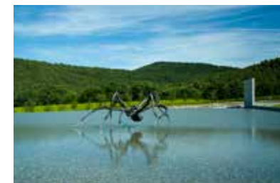
© Louise Bourgeois Crouching Spider 6695 © Easton Foundation New York - AD&P Paris 2016

Cette librairie « cosy » pour enfants organise des ateliers créatifs, des lectures et des séances de dédiées. 15, rue du Vieux Sextier www.librairieeauvive.fr