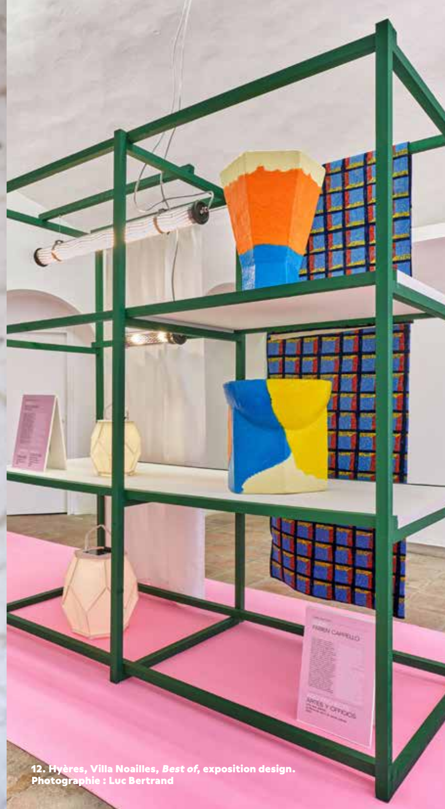
12. Hyères, Villa Noailles, Best of, exposition design.