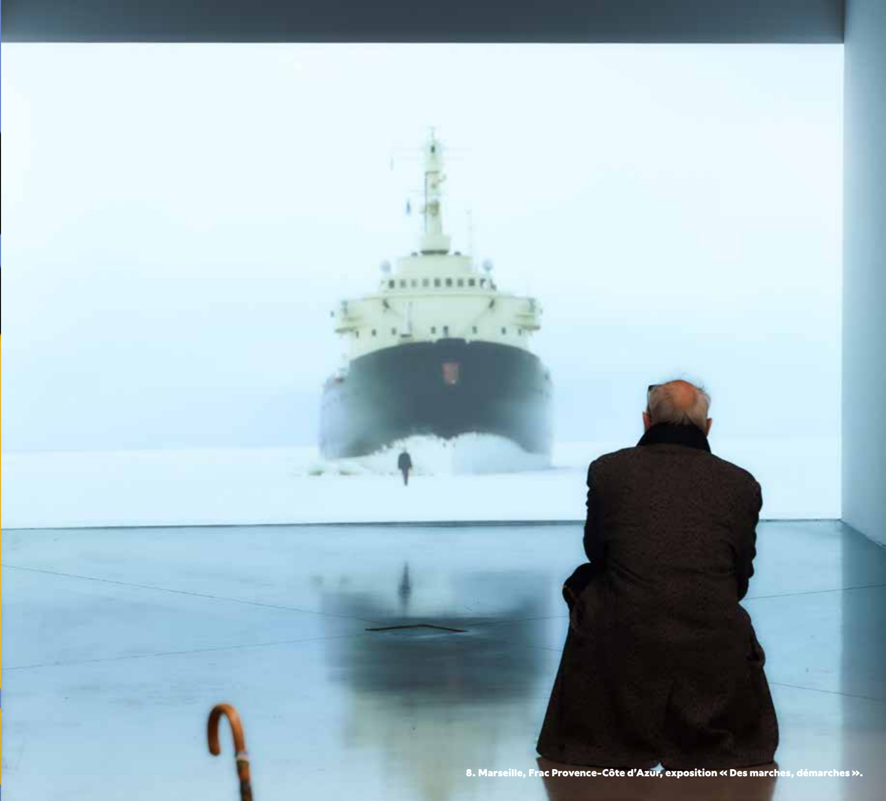
8. Marseille, Frac Provence-Côte d'Azur, exposition « Des marches, démarches ».