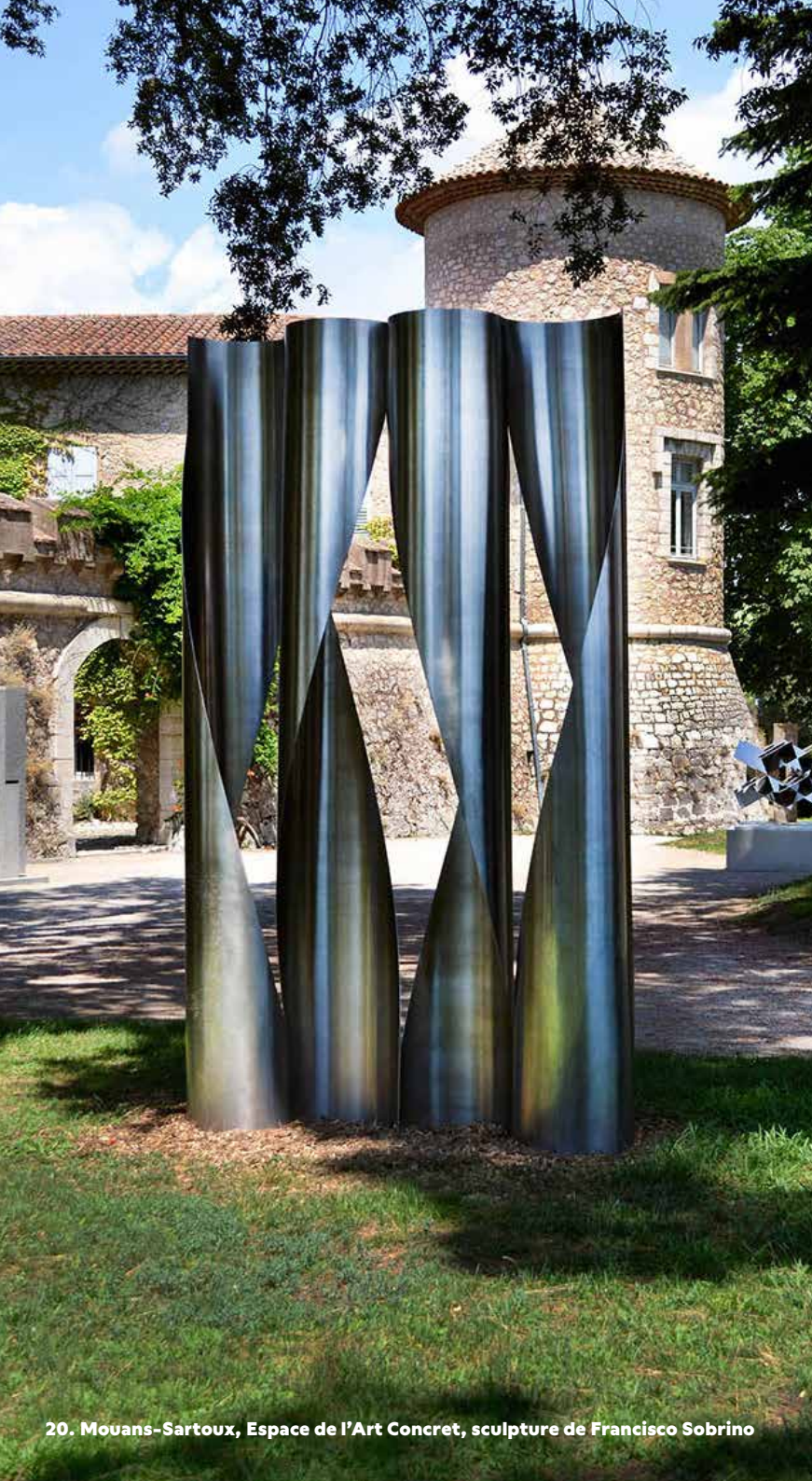
20. Mouans-Sartoux, Espace de l'Art Concret, sculpture de Francisco Sobrino