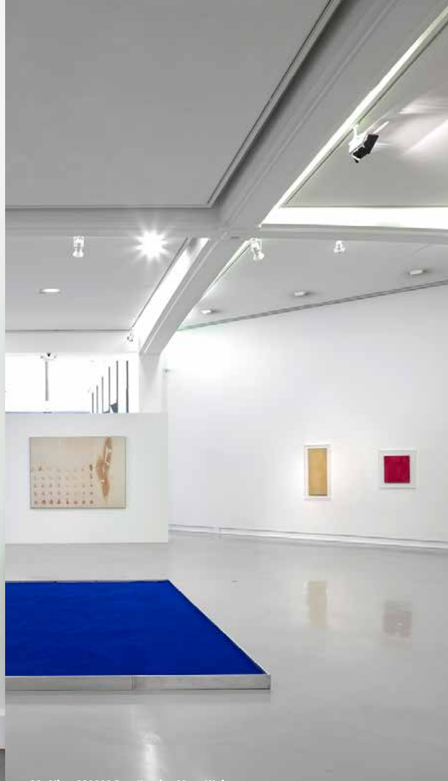
22. Nice, MAMAC, collection Yves Klein.