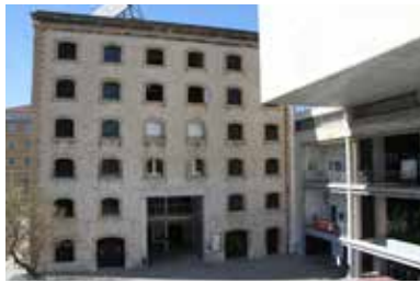
La Friche la Belle de Mai (2019) - Triangle Astérides

Renseignements sur la programmation complète : fraeme.art , art-o-rama.fr ou par téléphone. / Information about the complete programme: fraeme.art / art-o-rama.fr or by phone.