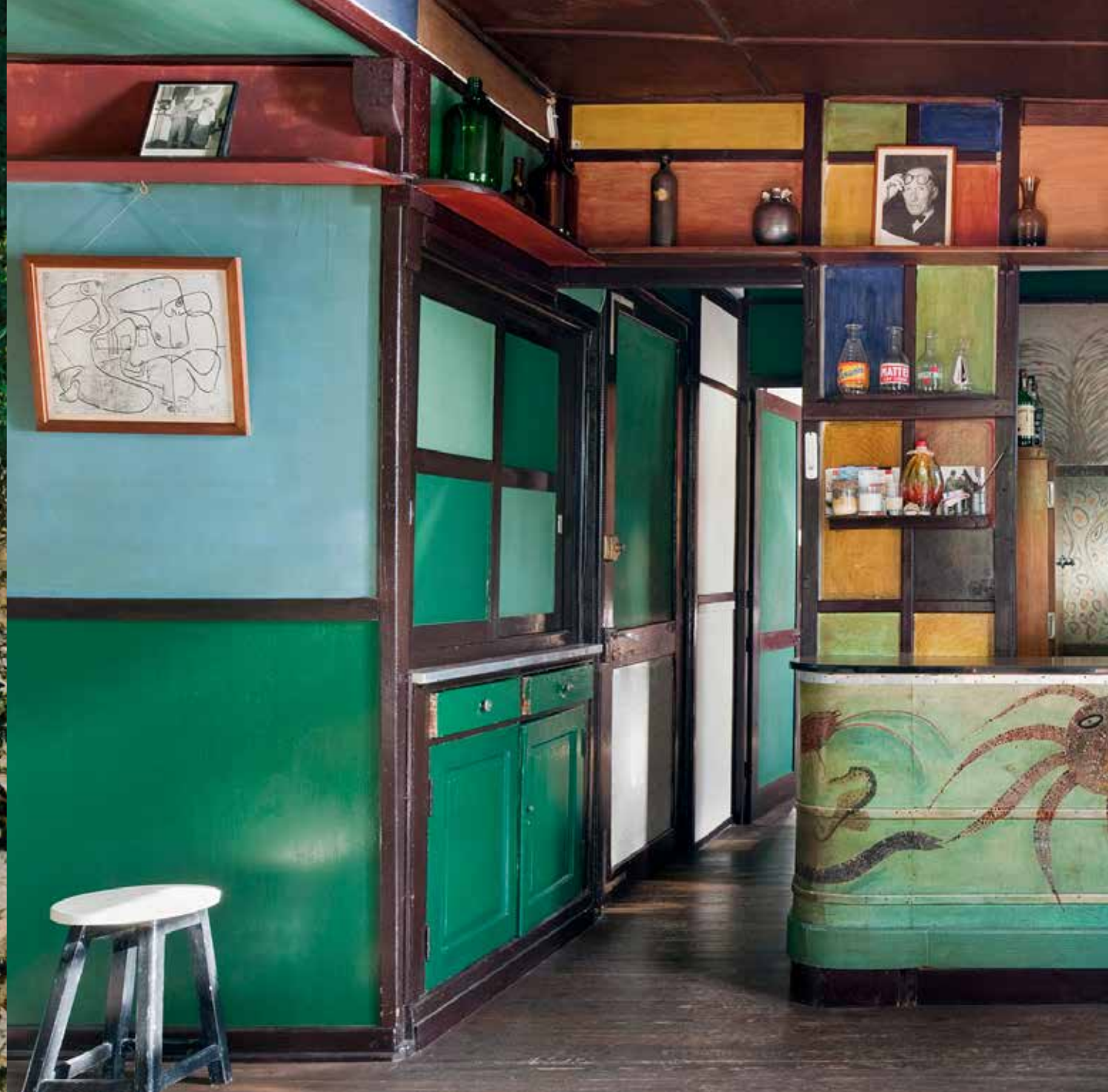
24. Roquebrune-Cap-Martin, Cap Moderne. Le bar de l'Étoile de mer , de Thomas Rebutato.