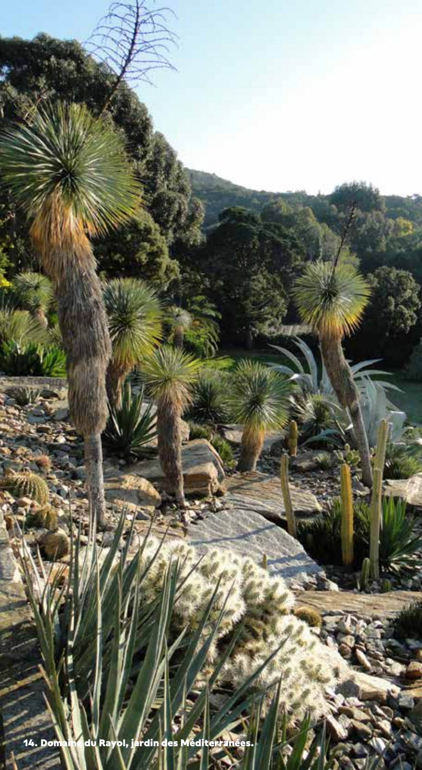
14. Domaine du Rayol, jardin des Méditerranées.