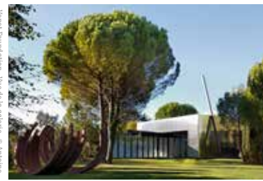
© Venet Foundation - Benoît Bouché - Autisme

Quatre tours rondes coiffées de tuiles vernissées symbolisant les saisons encadrent l'architecture provençale de ce château du XVIII e siècle. Après cinq ans de travaux, l'architecte d'intérieur Pierre Yovanovitch a redonné vie à la bâtisse et au jardin d'origine (qui avait disparu). Ce dernier a été entièrement redessiné par le paysagiste Louis Benech. La chapelle, quant à elle, s'est vue transformée en lieu dédié à l'art : Claire Tabouret y a réalisé sa première fresque. Fabrègues est l'expression pleine et entière de la signature de Pierre Yovanovitch, mêlant art contemporain, pièces de design et éléments du XVIII e siècle, ce qui confère un éclectisme singulier au site. / Built in the 17th century, Château de Fabrègues features four circular towers with tiling representing the four seasons, a quintessential Provencal design motif. Pierre Yovanovitch spent five years renovating the property and its surrounding gardens, which he enlisted landscape architect Louis Benech to help with. The historic chapel on the property was reimagined with a fresco by painter Claire Tabouret. Fabrègues is a true reflection of Pierre Yovanovitch's signature style, blending contemporary art within the context of a striking historic setting. The project is a primary example of his ability to seamlessly blend vintage and contemporary aesthetics while incorporating an unparalleled level of quality.