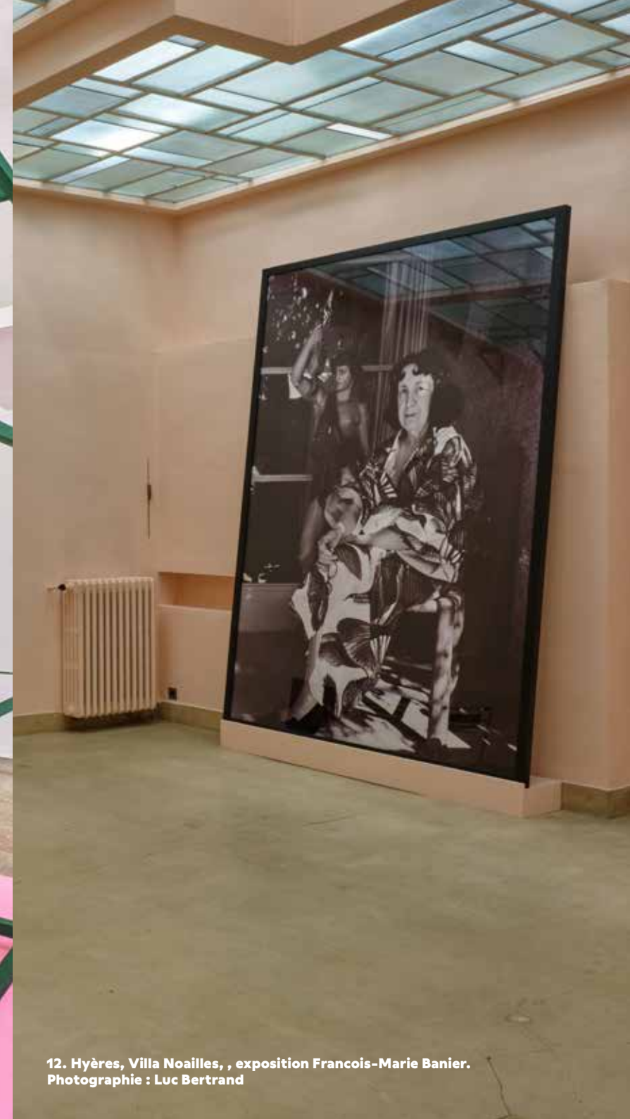
12. Hyères, Villa Noailles, , exposition Francois-Marie Banier.