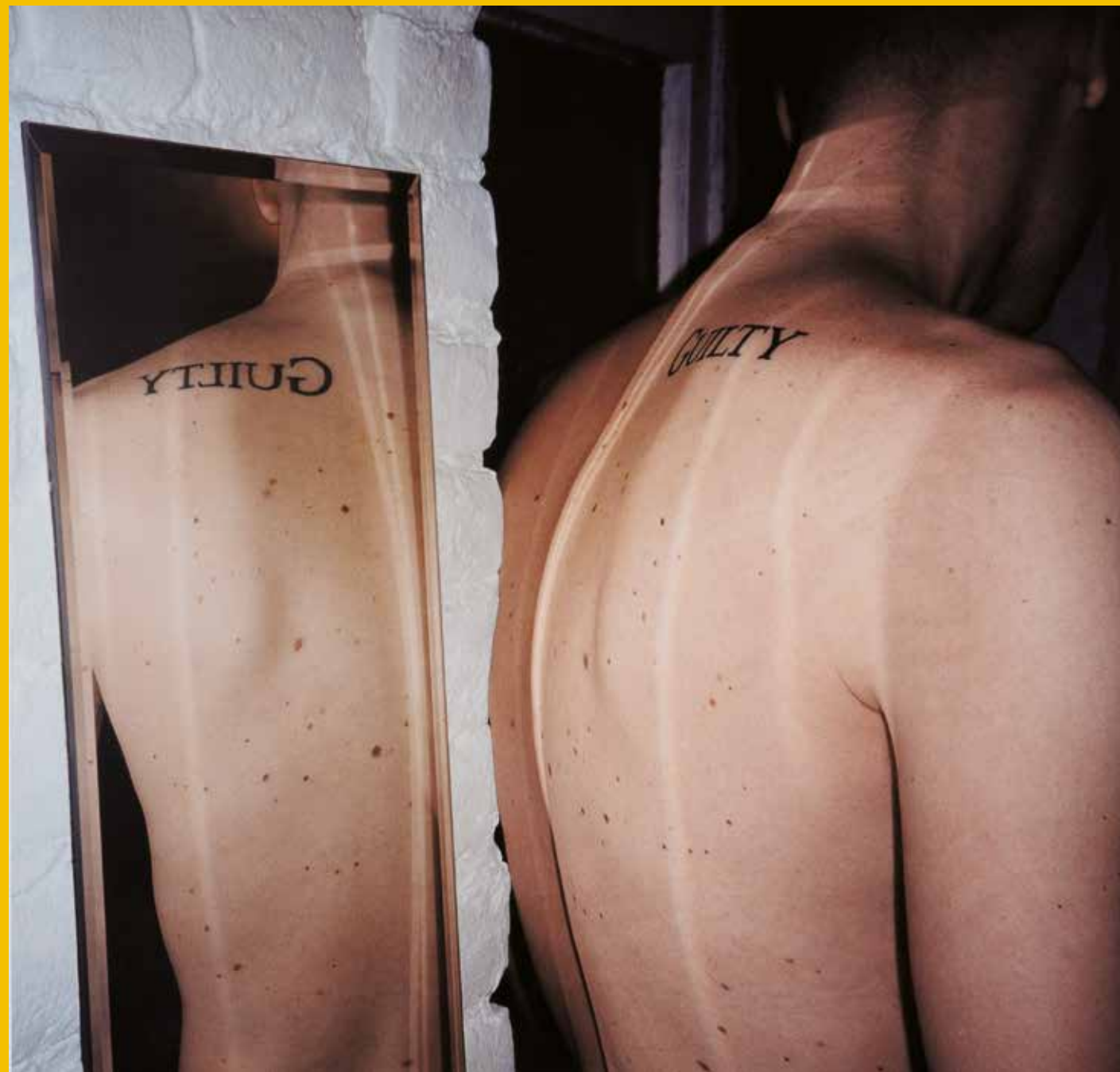
5. Avignon, Collection Lambert. Tattoo (for Reflection), de Douglas Gordon. Exposition «Je refléterai ce que tu es... De Nan Goldin à Roni Horn : l'intime dans la Collection Lambert». (Donation Yvon Lambert à l'État français).