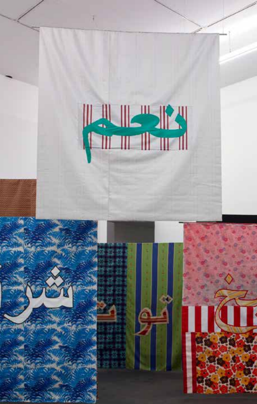
1. Sète, CRAC Occitanie, exposition « Qalqalah : plus d'une langue ».