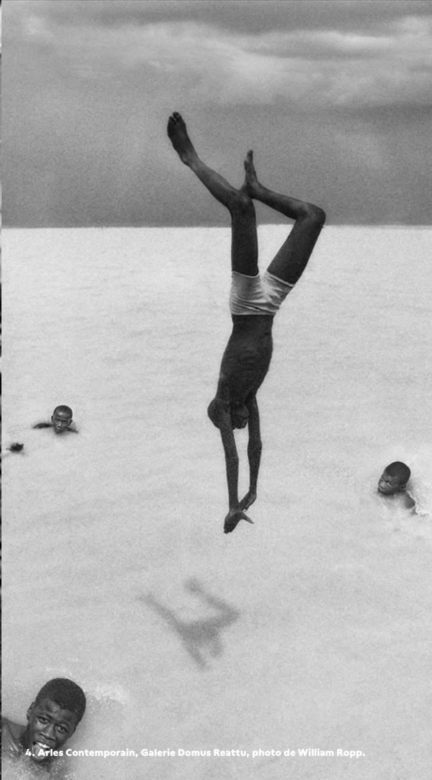
4. Arles Contemporain, Galerie Domus Reattu, photo de William Ropp.