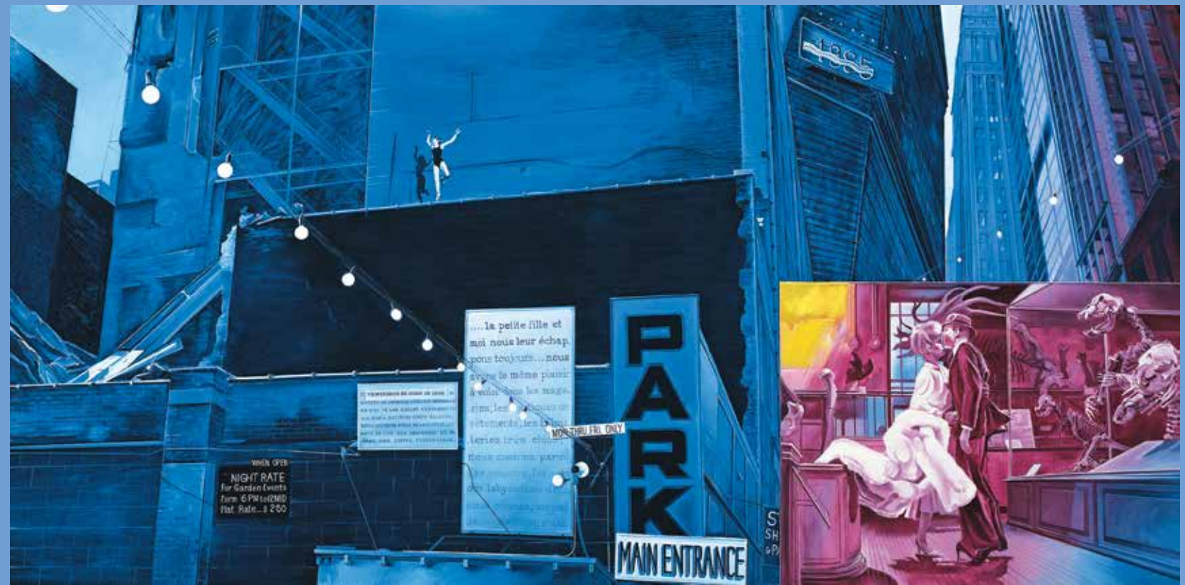
21. Saint-Paul-de-Vence, Fondation Maeght, exposition Jacques Monory.