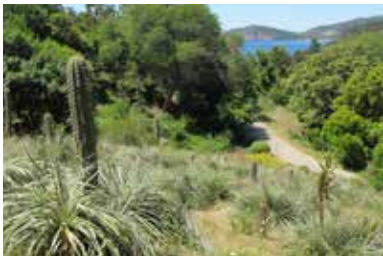
© Domaine du Rayol, Jardin du Chili-