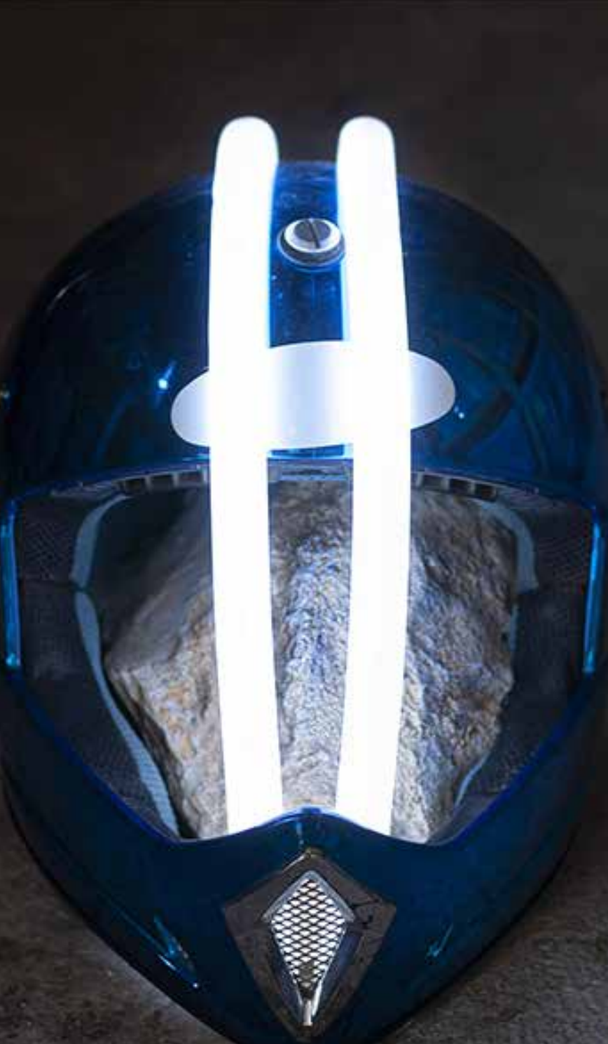
11. Toulon, L'axolotl Cabinet De Curiosités, Collision (In Solitude Of Memory) Part III , de Léo Fourdrinier, exposition «Pulse J'sistem».