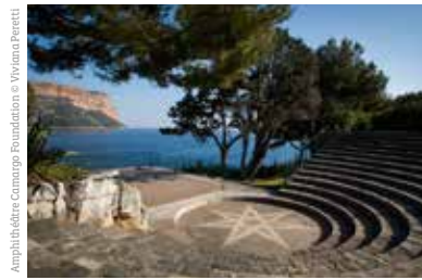
Amphithéâtre Camargo Foundation

GALERIE BÉA-BA Un lieu central pour la peinture contemporaine. 122, rue Sainte www.galerie-bea-ba.com