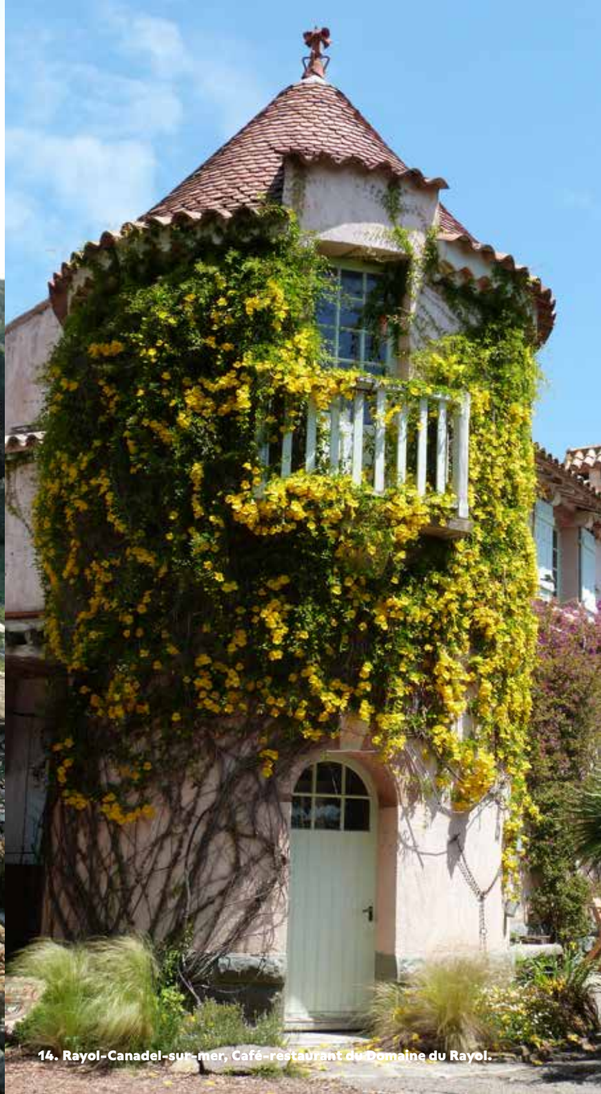
14. Rayol-Canadel-sur-mer, Café-restaurant du Domaine du Rayol.