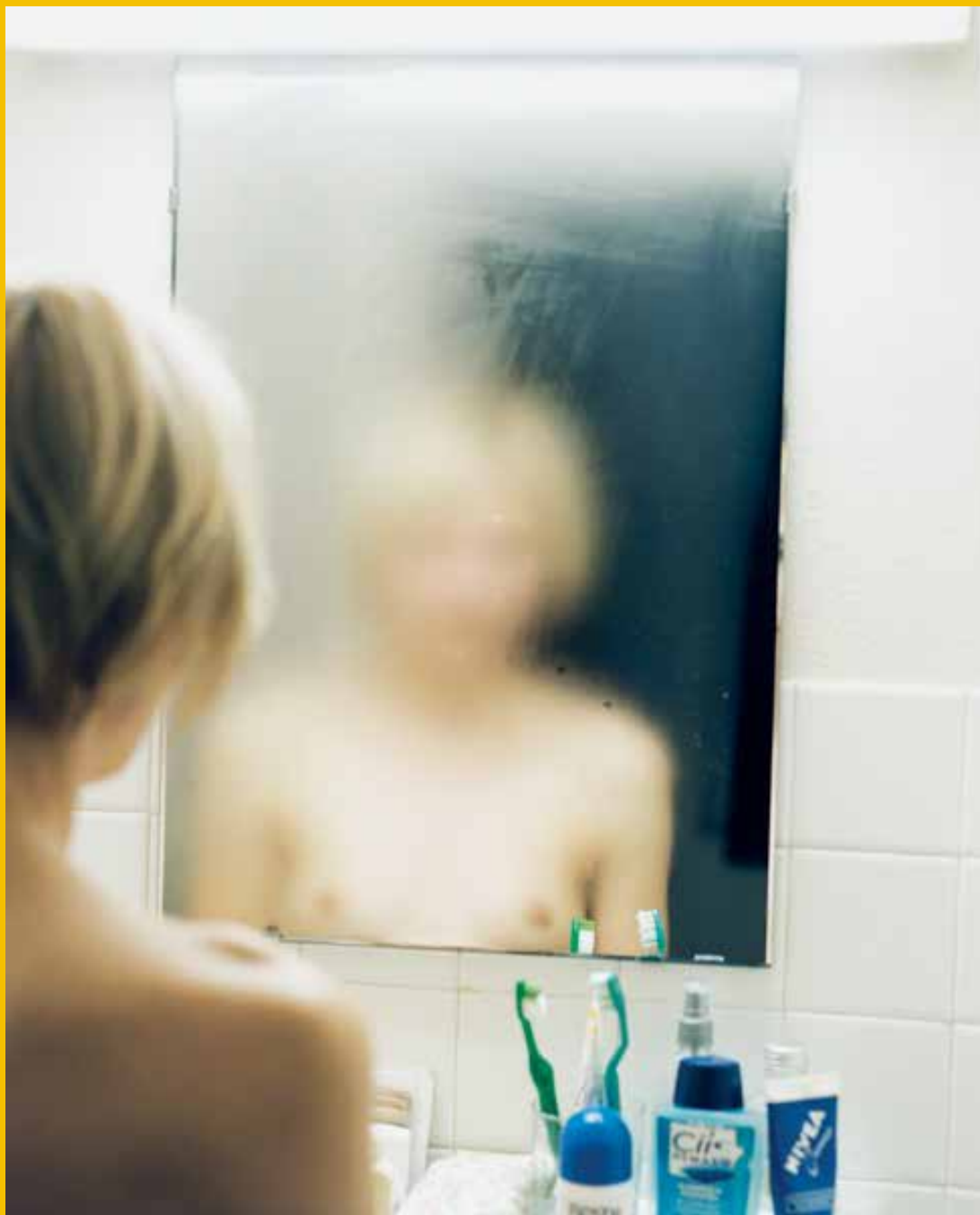
5. Avignon, Collection Lambert. Le miroir , d'Elina Brotherus (2000). Exposition «Je refléterai ce que tu es... De Nan Goldin à Roni Horn : l'intime dans la Collection Lambert» (Collection privée, Paris © ADAGP, 2020).