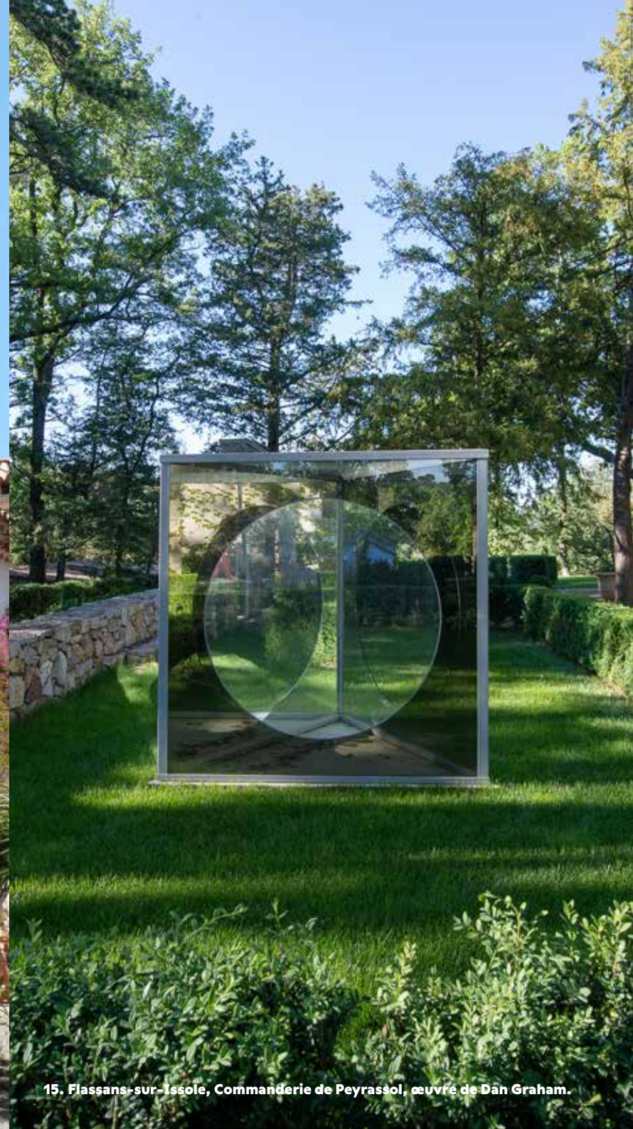
15. Flassans-sur-Issole, Commanderie de Peyrassol, œuvre de Dan Graham.