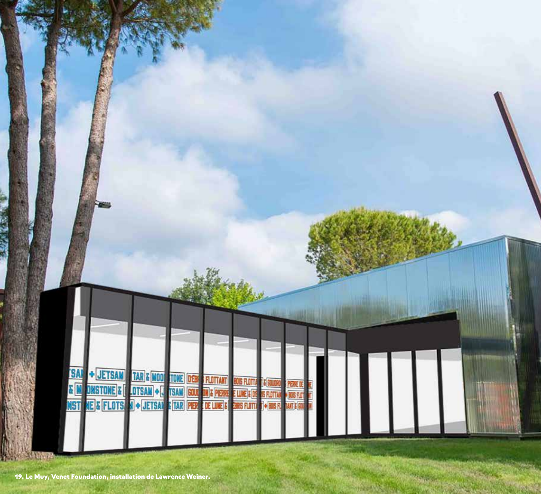
19. Le Muy, Venet Foundation, installation de Lawrence Weiner.