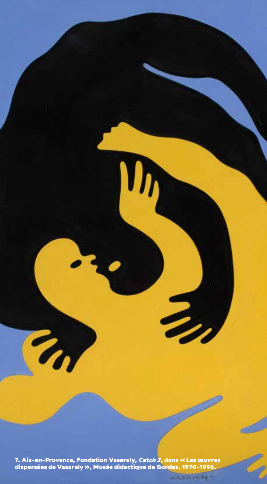
7. Aix-en-Provence, Fondation Vasarely, Catch 2 , dans « Les œuvres dispersées de Vasarely », Musée didactique de Gordes, 1970-1996.