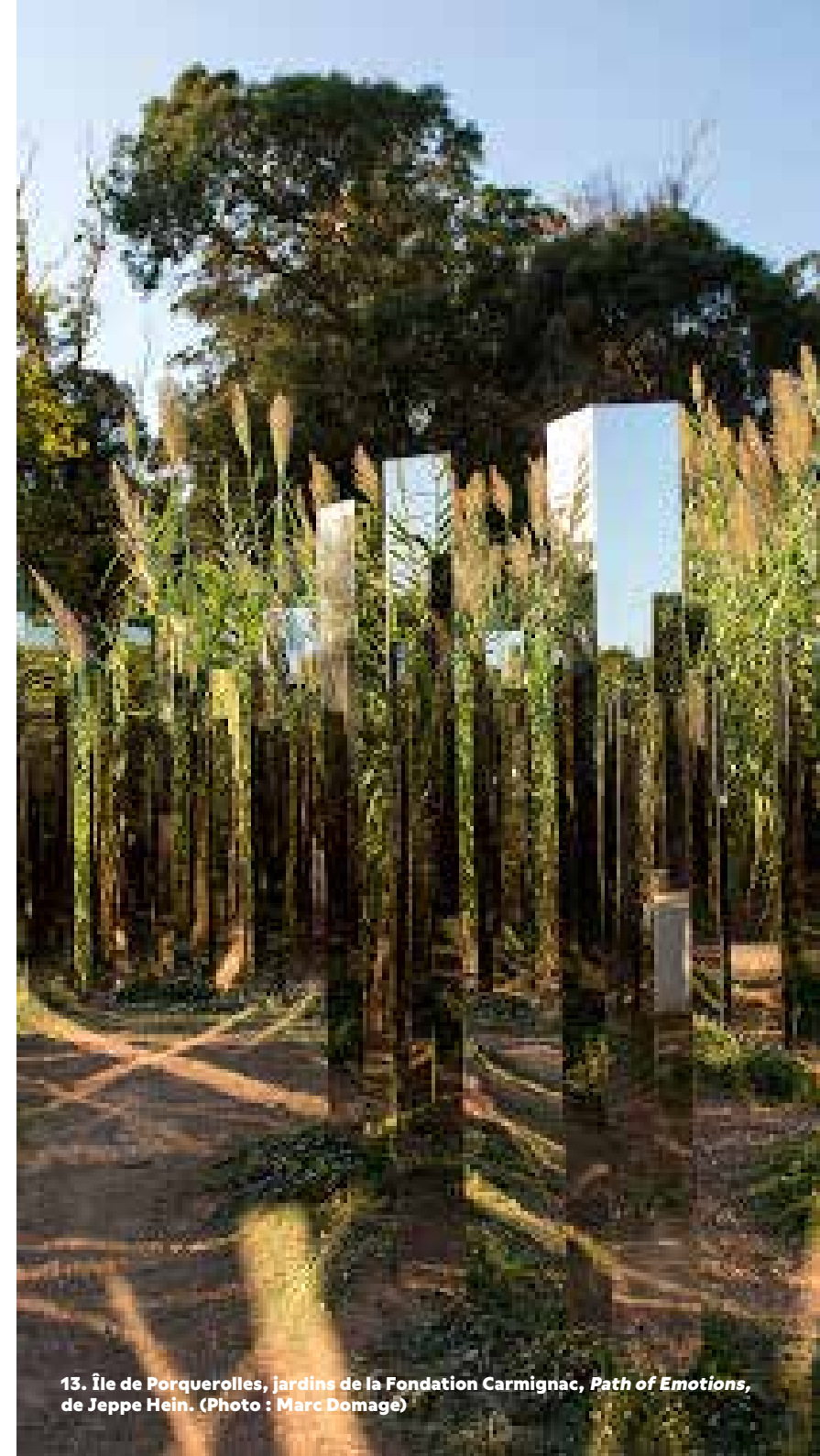
13. Île de Porquerolles, jardins de la Fondation Carmignac, Path of Emotions, de Jeppe Hein.

L'ATELIER DE SABINE Sabine, Artiste peintre, auteure, créatrice Porquerollaise. 66, rue Joseph Pellegrino www.atelierdesabine.com/