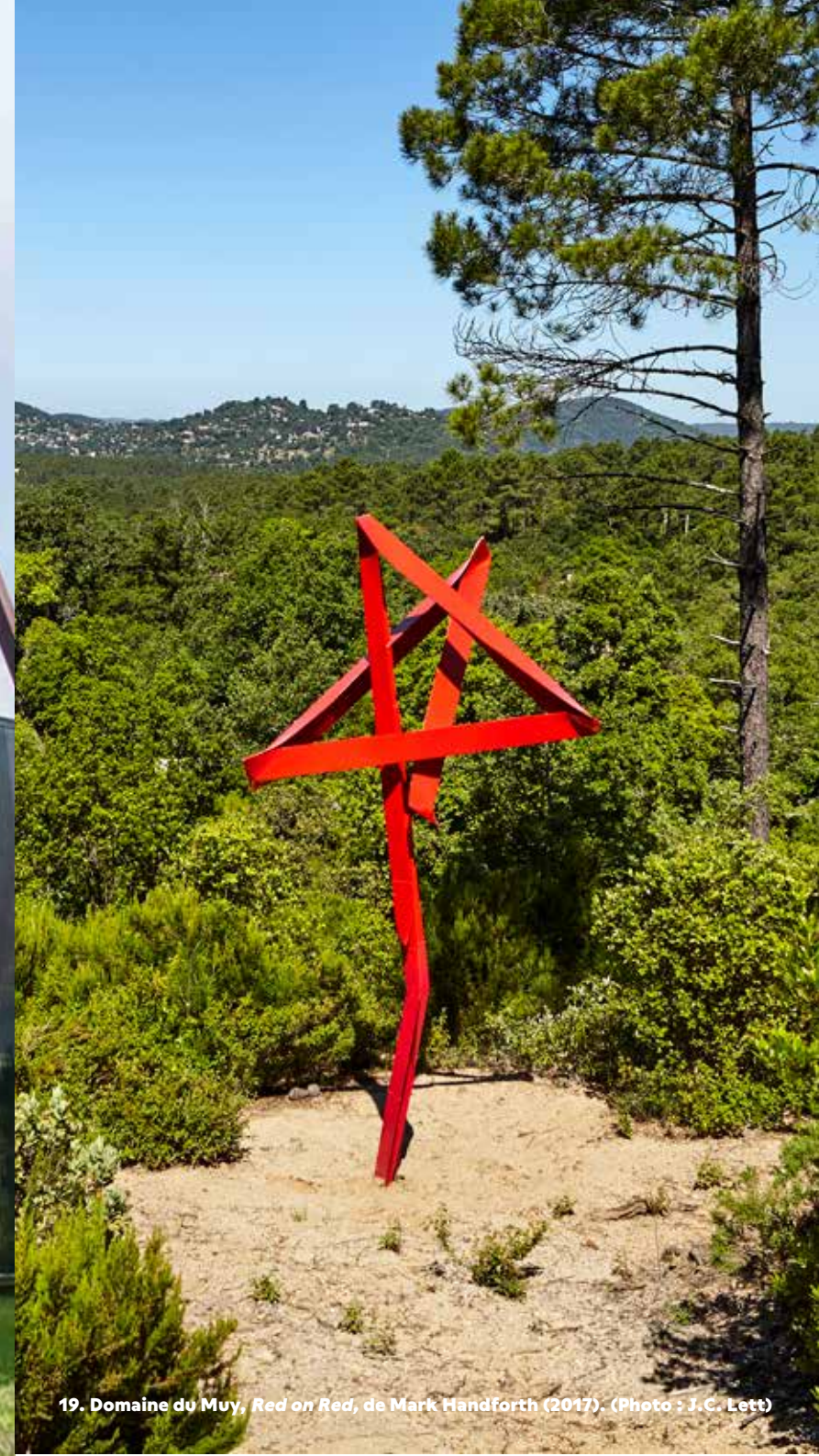
19. Domaine du Muy, Red on Red, de Mark Handforth (2017).