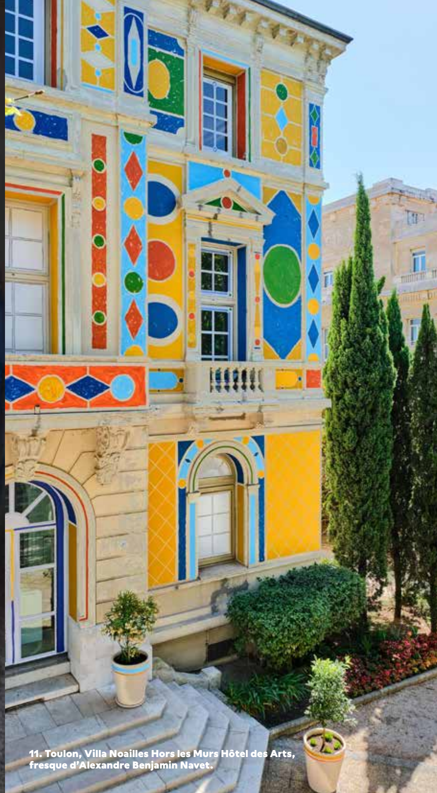
11. Toulon, Villa Noailles Hors les Murs Hôtel des Arts, fresque d'Alexandre Benjamin Navet.