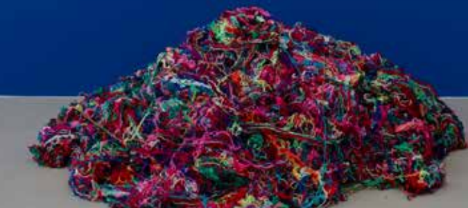
2. Montpellier, MO.CO, Hôtel des collections, exposition « Mearō. L'Amazonie dans la collection Petitgas ».