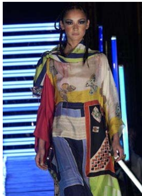
Collection Volage Sauvage

15 mai – 29 août 2009 vernissage jeudi 14 mai – 19h