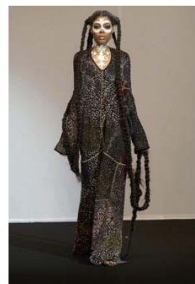
collection Incandescence chamanique