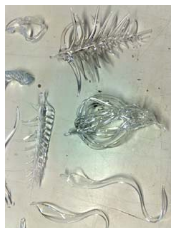
Lianes de verre