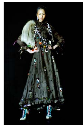
collection Vertige botanique

« Je coupe, découpe, teins, brode, customise, photographie et mets en scène une approche primitive, naturelle, onirique, poétique, rituelle, basée sur une pulsation profonde de liberté, superposant les idées, les techniques, les effets ». Fred Sathal