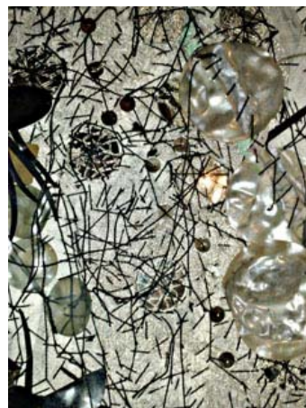
Mon antre