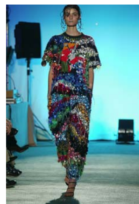
collection Paradise Rainbow