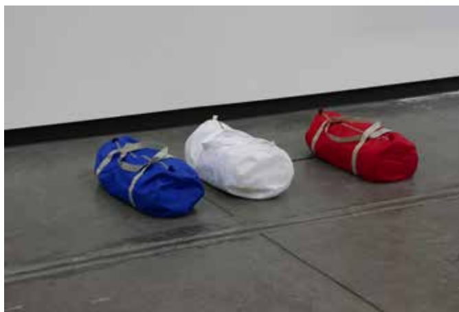
Delphine Reist, France , 2016 Collection Frac Bretagne © Delphine Reist

Trois sacs de sport sont posés sur le sol. N'était le contexte de l'exposition (et l'œuvre s'intitule France ), on pourrait croire qu'ils ont été oubliés là. Mais : trop bien rangés pour être honnêtes, et dans le sens bleu, blanc, rouge de surcroît ! Alors on s'approche et en voilà un qui se met à onduler, puis un autre, comme s'ils étaient vivants ! L'inerte de l'accessoire sportif semble avoir été contaminé par la dynamique des corps, produisant ainsi une sorte de métonymie tridimensionnelle : objets inanimés, avez-vous donc une âme ? Chez Delphine Reist, il faut bien leur reconnaître une certaine autonomie.