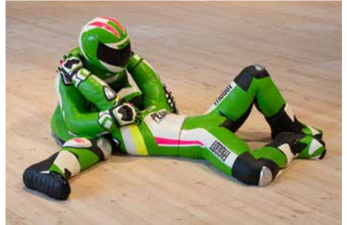
Louka Anargyros, Leatherboys , 2018 Céramique, peinture, 250 x 150 x 40 cm

Leatherboys , les couples enlacés sur le sol de Louka Anargyros sont des représentations réalistes de motards de compétition dans la combinaison flamboyante qu'ils arborent. Premier trouble : on voit rarement ces champions virils s'abandonner ainsi dans l'étreinte amoureuse. Second trouble : les inscriptions publicitaires qui ornent généralement ces tenues de cuir sont ici des insultes homophobes issues de différentes langues. La revendication bravache d'une identité sexuelle cohabite ici avec la dénonciation de l'homophobie.