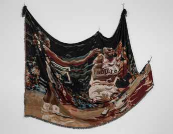
Noel W. Anderson, Untitled 2020–2022 Tapisserie en suspension, coton

Si l'on peut dire de Noel W. Anderson qu'il inscrit sa pratique dans une certaine tradition de la peinture c'est d'une manière qui trouve sa source dans l'histoire des arts décoratifs, celle de la tapisserie évidemment qui, avec L'Apocalypse d'Angers ou La Dame à la Licorne (musée de Cluny, Paris), a fourni à l'histoire de l'art des chefs-d'œuvre incontestables. Cette œuvre appartient tout aussi bien à la plus pure contemporanéité par l'importation de matériaux hétérodoxes comme des serviettes ou des lamelles de ballons de basket. Quant à ses sujets, il s'agit le plus souvent du corps et du visage de stars africaines américaines de la NBA, ces corps noirs aussi efficaces que séduisants auxquels on réduit trop souvent l'image qu'on se fait des minorités racisées. Les torsions auxquelles Anderson soumet ces joueurs rappellent aussi la manière dont Francis Bacon, cette fois par les stricts moyens de la peinture et à des fins autres, n'était l'identique violence, la semblable somptuosité, représente ses corps, mais aussi certains de ses visages.