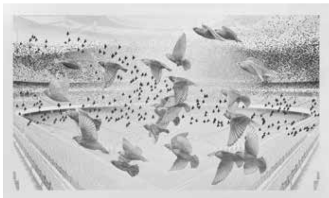
Jean Bedez, Murmuration aux cent sonnets , 2023

L'œuvre tout entier de Jean Bedez prend la forme de grands dessins d'une virtuosité sidérante où se voient tantôt des figures issues de la sculpture antique, tantôt de vastes compositions fondées sur ce qu'on pourrait appeler des collages (au sens conceptuel du terme) iconographiques spatio-temporels dans lesquels entrent en tension grands thèmes des mythologies antiques ou chrétiennes et paysages ou architectures contemporains. Sursaturés sur les plans sémantique et graphique, à la manière des tableaux anciens, ils réarticulent un regard aigu sur le monde actuel aux grands mouvements de la pensée et de la représentation de l'éternelle humanité et de sa ruine. Ainsi Constellation de la vierge (2015) réunit-elle en un cocktail explosif motifs sportifs, décor de grand hôtel, signes de l'une des plus anciennes constellations du Zodiaque et marque (666) de la bête dans l'Apocalypse. L'ambition n'est pas moindre avec ce triptyque inédit, Murmuration aux cent sonnets (inspiré d'un recueil de poésies de Boris Vian), qui, sur fond de l'architecture monumentale de l'Emirates Stadium, le stade londonien d'Arsenal, montre des nuées d'étourneaux. Entre frayeur hitchcockienne et prise en compte attentive du monde animal, Bedez fournit dans ce grand dessin aux significations très ouvertes, une méditation sur l'idée de la masse (théorisée ailleurs par Elias Canetti : « l'état de l'égalité absolue ») et de son fonctionnement, le monde sportif comme théâtre privilégié de son exemplification.