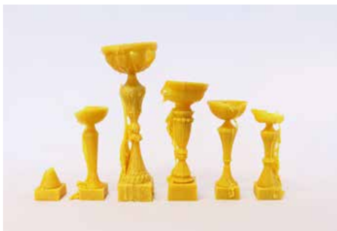
Thomas Tudoux, Graals , 2017 Cire, format variable

Production : Centre d'art contemporain de Pontmain & la Crypte d'Orsay Collection de l'artiste © Thomas Tudoux