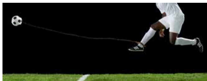
Hank Willis Thomas, Football and Chain , 2017 69 x 179 cm, tirage numérique couleur, encadré

Une part essentielle de la culture populaire à laquelle s'intéresse Hank Willis Thomas concerne le sport, basket, football américain, soccer, etc. La beauté vénéneuse de ses images (celle-ci, Football and Chain ), montre à quel point le lien physique entre le pied du joueur et le ballon relève bien de l'enchaînement, c'est-à-dire de l'aliénation, tout particulièrement s'agissant des Africains-Américains. Mais ce serait réduire la portée et la force de ces photographies que de n'y voir que de la dénonciation, il y est aussi question de la beauté inhérente à cette servitude volontaire, comme ailleurs la terrible beauté des combats.