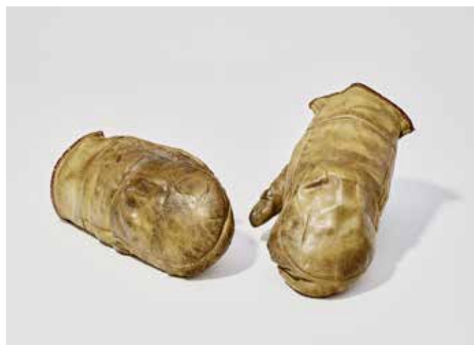
Gants de boxe de Marcel Cerdan, 1944-1946 Cuir, coton Musée National du Sport, Nice

Le 29 septembre 1948, en à peine une demi-heure, Marcel Cerdan est passé du statut de champion à celui de héros en terrassant l'Américain Tony Zale, au onzième round de leur confrontation à Jersey City. Le « Bombardier marocain » disputait à 32 ans son 111 e combat, n'ayant concédé que trois défaites. Cerdan devient un mythe absolu à son retour en France. Il est accueilli par des centaines de milliers de fans, de l'aéroport du Bourget aux Champs-Élysées. Du jamais vu pour un sportif. La perte de son titre neuf mois plus tard, en juin 1949, face à Jake LaMotta, n'écorne en rien sa popularité. La revanche, signée, n'eut jamais lieu, Marcel Cerdan perdant la vie dans le crash de l'avion qui le ramenait aux États-Unis, le 28 octobre 1949. Cette mort l'ancre un peu plus encore dans l'imaginaire collectif des Français. Tout comme sa relation amoureuse et passionnée avec Edith Piaf, rencontrée à New York en 1947.